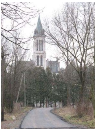
Ulica Słoneczna (boczna)