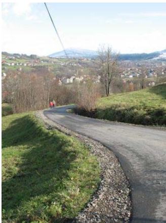
Droga na Zarąbki