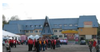
Elewacja budynku na stadionie miejskim