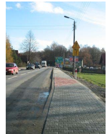
Chodnik ul. Krakowska