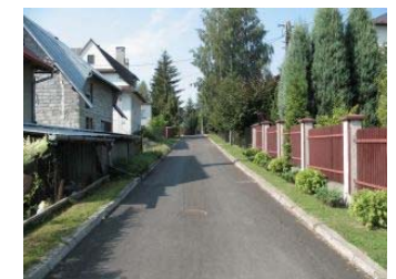
Ulica I Armii WP