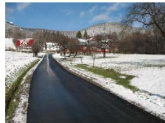
Ulica Leśna – do ujęcia wody dla miasta, po remoncie.

Wielu rzeczy na pewno nie udało się osiągnąć, a to ze względu na ograniczenia finansowe, a to czasowe. Również ze względu na to, że oczekiwania są zawsze większe od możliwości.