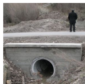
Przepust os. Ścibory