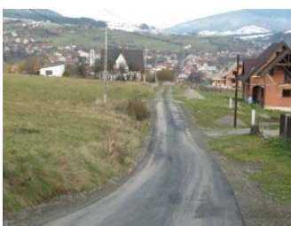
Ulica Mroza (Pańskie)