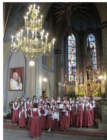
Zespół dziewczęcy z Kasinki Małej podczas I Zagórzańskiego Przeglądu Chórów „Laudate Dominum” w kościele św. Michała Archanioła w

wyróżnienia i dyplomy - nie sposób wymienić wszystkich. Dodatkowe puchary, którymi może pochwalić się Miejski Ośrodek Kultury to m.in. I miejsce w kategorii